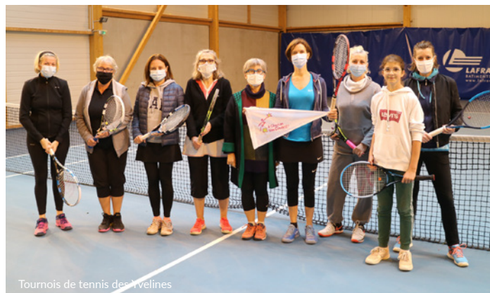
Tournois de tennis des Avelines

L'UTMB a dû prendre la difficile décision d'annuler cet événement de renommée internationale. Ce trail fait vibrer chaque été la Vallée de Chamonix et joue un rôle actif dans le tissu associatif. Si nos vingt-cinq coureurs solidaires n'ont pas pris le départ, tous continuent de nous soutenir. Nous sommes très reconnaissants aux organisateurs de l'UTMB, la Commission de Solidarité et le Rotary Chamonix Mont-Blanc Megève qui d'ores et déjà travaillent à la réussite de l'édition 2021.