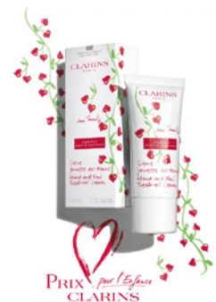
PRIX pour l'Espoir CLARINS