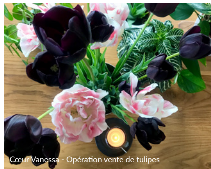
Cœur Vanessa - Opération vente de tulipes

La Cordée Francilienne (en Ile-de-France), La Cordée Bretonne (en Bretagne), La Cordée Val de Loire (en Touraine) et Cœur Vanessa (en Rhône-Alpes) ont bien sûr vu leurs actions impactées par la crise sanitaire. Toutefois, elles aussi ont redoublé d'ingéniosité : confection de masques en tissu, rédaction d'un livre de recettes participatif, brocante, vente de tulipes. Elles n'ont pas chômé !